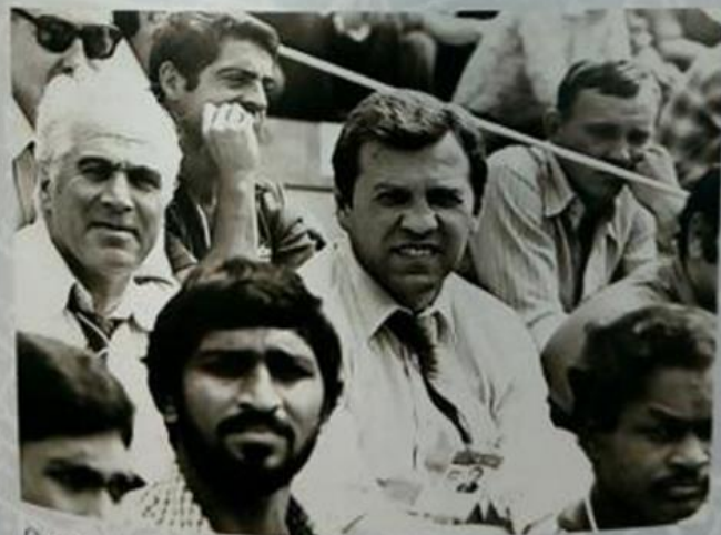
Олимпиада-80 в Москве. Борис Майоров на одном из матчей по хоккею на траве. Слева – знаменитый голкипер сборной СССР по хоккею с шайбой Григорий Мкртычян