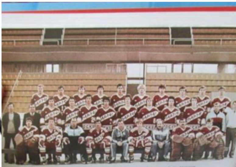
Игорь Ларионов, Борис Майоров и другие игроки сборной СССР в составе «Спартака» (Москва)